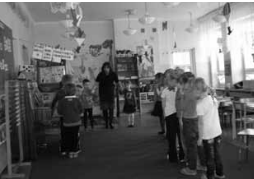
Warsztaty edukacyjne na temat wilka, wydry i bobra w przedszkolu w Monkach

Grupa dorosłych obejmowała zarówno nauczycieli wychowania przedszkolnego, szkół podstawowych i gimnazjów oraz osoby zajmujące się edukacją przyrodniczą w lokalnych instytucjach (80 spotkań). Okazuje się, że wiedza tych osób często jest niepełna lub błędna i wymaga weryfikacji i uzupełnienia. Na przykład, według dość powszechnie panującego błędnego poglądu bobry jedzą ryby, choć jest to gatunek typowo roślinożerny. Także część nauczycieli nie kryła swojego lęku wobec wilków – potwierdzało to ich przeświadczenie o konieczności