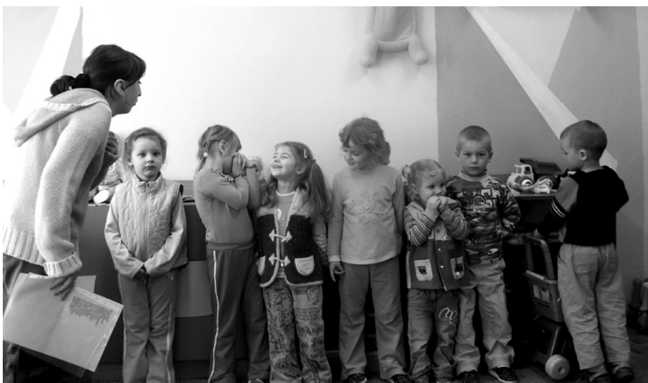
Zajęcia z dziećmi w Wiejskich Ogniskach Przedszkolnych Towarzystwa Przyjaciół Dzieci