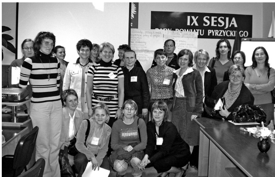
Uczestniczki cyklu zajęć dotyczących programu „Zero tolerancji” zorganizowanego w Pyrzycach

Bardzo cenię sobie tę formę pracy z rodzicami. Z moich doświadczeń w pracy wiem, że większość problemów z dziećmi ma swoje podłoże w błędach wynikających z braku prawidłowej komunikacji pomiędzy rodzicami i dziećmi, a którą my staramy się poprawiać.