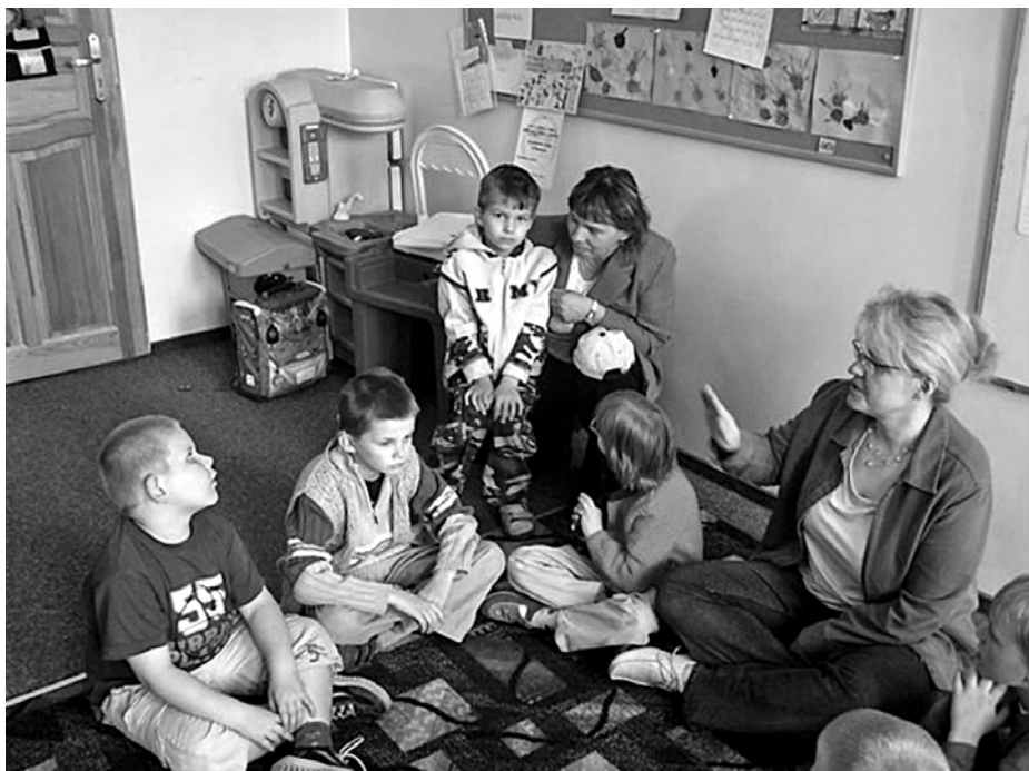
W „zerówce” różnie z rodzicami

Podsumowując efekty realizacji programu „Iskierka”, stwierdzam, że przyniósł on oczekiwane rezultaty. Rodzice potrafią pracować ze swoim dzieckiem w warunkach domowych, znają metody i formy pracy z dzieckiem z wadą słuchu, korzystają ze wsparcia nauczycieli i logopedów, potrafią radzić sobie w różnych sytuacjach wychowawczych, nawiązali lepszy kontakt psychiczny i emocjonalny ze swoim dzieckiem, angażują innych członków rodziny do rehabilitacji dziecka, lepiej rozumieją jego potrzeby oraz wiedzą, gdzie mogą udać się po specjalistyczną pomoc. ■