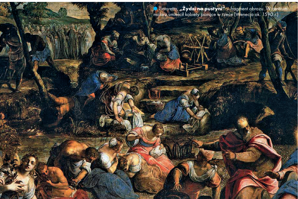
● Tintoretto, „ Żydzi na pustyni ” – fragment obrazu. W centrum malarz umieścił kobiety piorące w rzece (Wenecja ok. 1590 r.)

Już w jednym z najstarszych dzieł literatury europejskiej, mianowicie w Odysei Homera pojawia się malowniczy opis prania bielizny. Córka króla Feaków, piękna Nauzykaa wraz ze swoimi dwórkami udaje się nad rzekę. Tam, zgodnie z greckim duchem wszechobecnej sportowej rywalizacji, młode kobiety biorą się do prania na wyścigi.