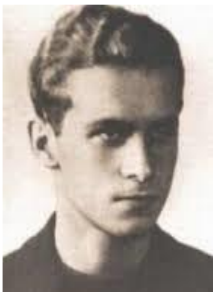
1938 r. – Baczyński zadebiutował w czasopiśmie „Strzały” (Stowarzyszenia „Spartakus”).