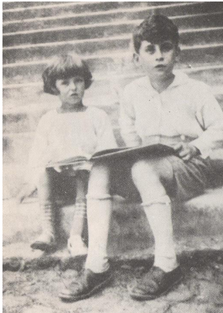
Krzyś Baczyński z książką.